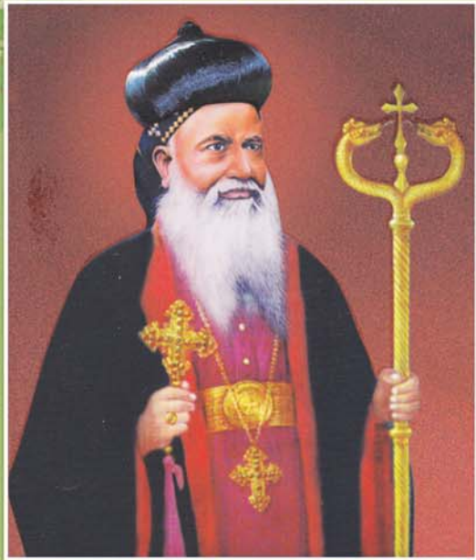
മലങ്കര മെത്രാപ്പോലീത്ത ജോസഫ് മാർ ദിവന്നാസിയോസ് V ജൂലൈ 12, കോട്ടയം പഴയ സെമിനാരി