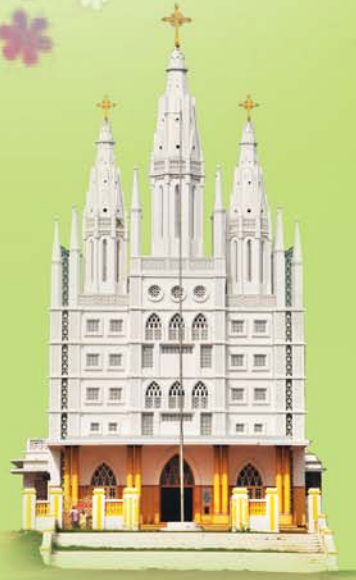
മലങ്കര മെത്രാപ്പോലീത്ത മാർത്തോമ്മ VII ജൂലൈ 5, കോലഞ്ചേരിപ്പള്ളി