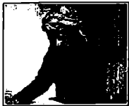
الرئيس المناضل مسعود البارزاني

أحد الجوانب الهامة في حياة الرئيس مسعود البارزاني، وهو الذي قاد الشعب الكردي في كفاحه الوطني العظمى من أجل الحرية والديمقراطية والعدالة الاجتماعية، وفي هذا الصدد، فإننا نذكر بعضاً من مواقفه التي تعكس عمق تفكيره ونبل شخصيته.