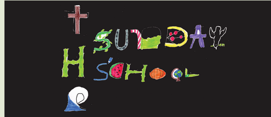
By Joshua Aby, Class IV