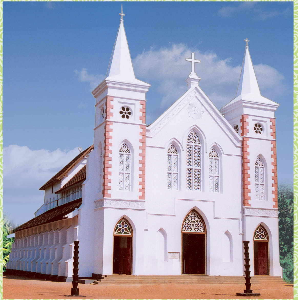
ST. MARY'S VALIYAPALLY, NIRANAM