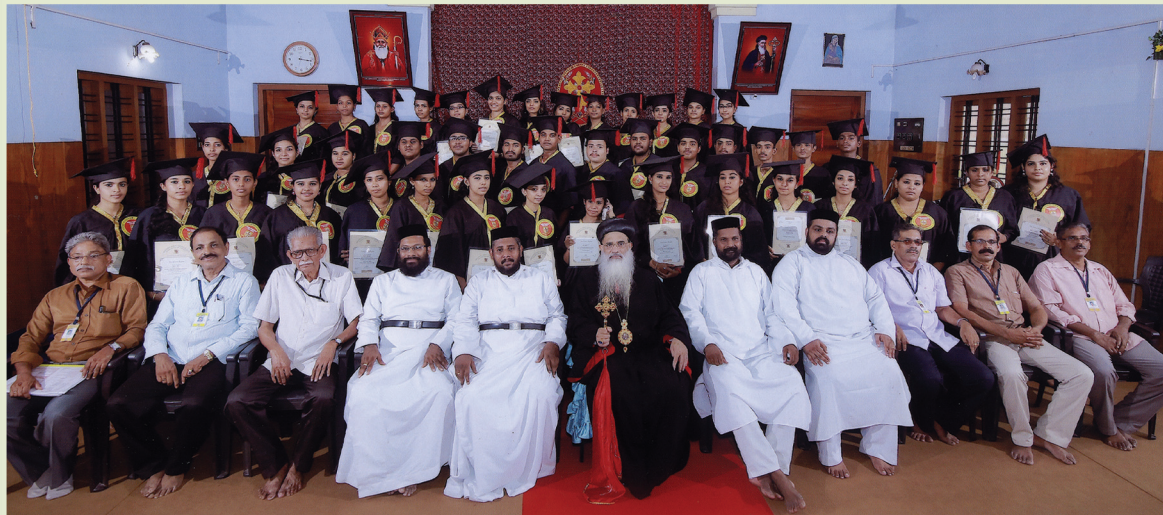
OSSAE KUNNAMKULAM DIOCESE VEDA PRAVEEN DIPLOMA CONVOCATION - 2016