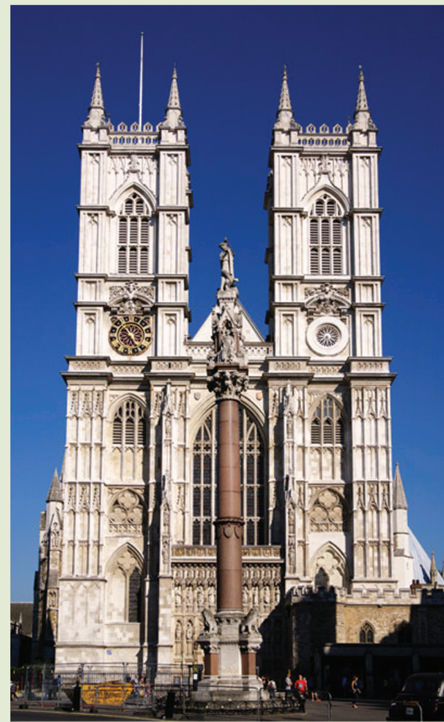
Westminster-Abbey (See page 16)