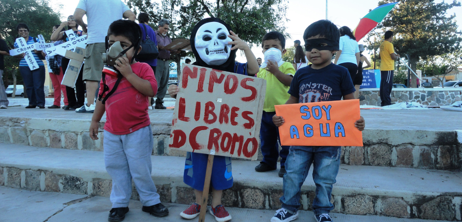
Niños sin cromo Clara Olmedo - Chilecito, La Rioja - 2014

Los niños y las niñas son los sujetos más afectados por la contaminación de la curtiembre de Nonogasta. Los maestros de escuela relatan cómo algunos empiezan a vomitar a consecuencia de los gases sulfurosos que emite la planta dentro del proceso del curtido del cuero. También hay un porcentaje más alto de la media que padece problemas gastrointestinales a causa de la contaminación. Sin embargo, no hay ni estudios epidemiológicos ni de ningún tipo. Tampoco hay alguien que se haga responsable por las afecciones que la población de Nonogasta sufre por la contaminación. La doctora Patricia Ripa, Pediatra Delegada Sanitaria Federal, afirma: “El cromo está en el aire, en el agua y en el suelo y produce malformaciones durante el embarazo”, y agrega que esta sustancia “es muy destructiva para la salud, no tiene ni color, ni sabor, ni olor. Es imperceptible”.