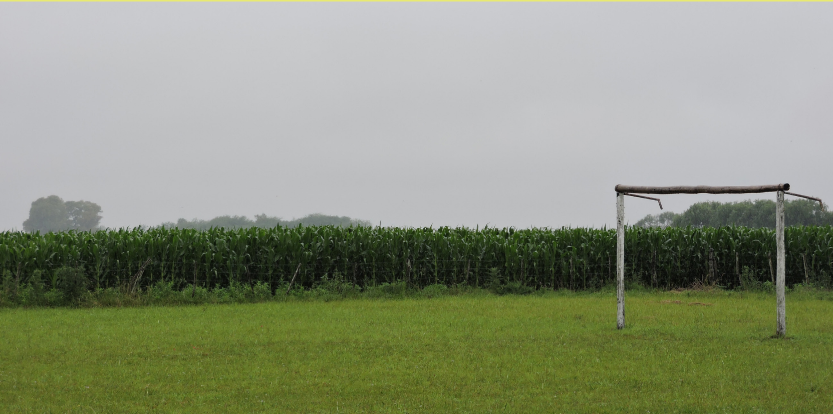
Foto tomada en una escuela rural de Entre Ríos, en el marco de un relevamiento ambiental realizado para dos trabajos finales de grado y uno extensionista de EMISA (FCE-UNLP), en conjunto con la campaña “Paren de Fumigar las Escuelas” de AGMER (Asociación del Magisterio de Entre Ríos). En el patio de la escuela, el cerco de la cancha de fútbol es un campo de maíz. Estos cultivos son fumigados con frecuencia, muchas veces en horario de clase. ¿A qué nos podemos acostumbrar? ¡Paren de fumigar las escuelas!