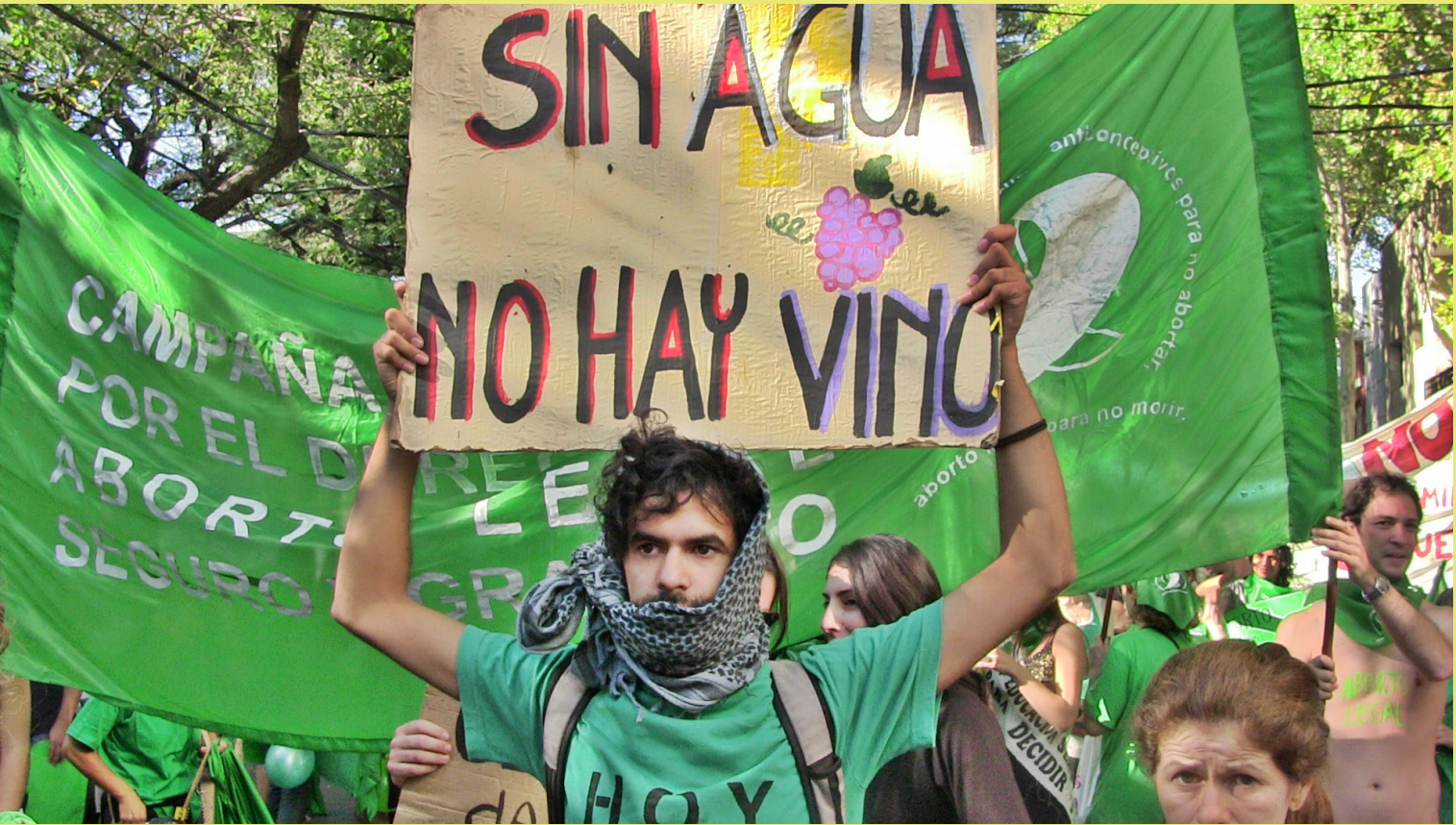
Marcha por el Agua contra la megaminería, realizada cada año en el marco del Carrusel Vendimial. En 2012 coincidió con el XVIII Encuentro de la Unión de Asambleas de Comunidades (UAC).